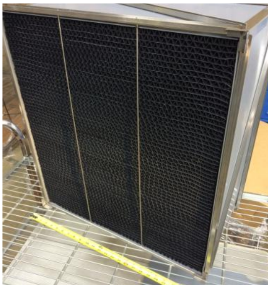
Moduł adsorpcyjny systemu GORE™ GMCS