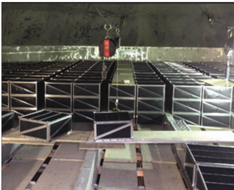
Moduły systemu GORE™ GMCS zainstalowane w absorberze IMOS w elektrowni w USA.

W Europie działa jeden system GORE™ GMCS zainstalowany w elektrowni opalanej węglem brunatnym w Chemnitz w Niemczech. Zapewnia redukcję emisji rtęci i SO 2 do poziomów wynikających z nowych uregulowań prawnych.